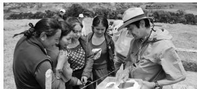
上：墓から出土した大型巻貝を手にする 2022年 下：墓の出土品を地元の人に説明する 2023年 (ペルー北高地ラ・カビーヤ遺跡)