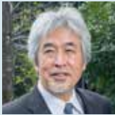
山極 壽一 やまぎわ じゅいち